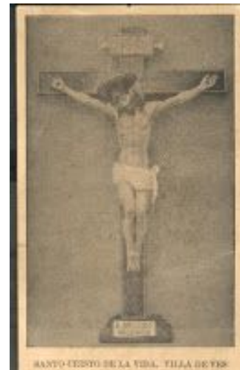
Antigua estampa del Cristo de la Vida

En la actualidad, el emplazamiento de esa primera Villa de Ves corresponde a lo que hoy es El Barrio del Santuario, mientras que la Villa de Ves es un agrupamiento que nació a finales del siglo XIX, y que sirvió para que se fuera despoblando el emplazamiento original por otro que diera más y mejores condiciones de vida que las que presentaba el emplazamiento en las laderas del cañón.